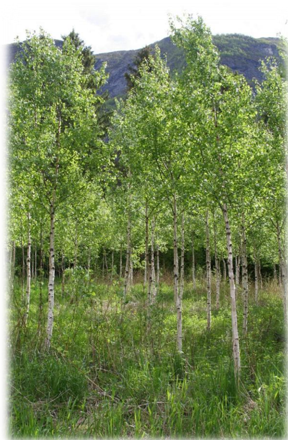
Valbjørk i Seimsdalen

Skogen i dei tre kommunane er ein viktig ressurs som i dag vert lite utnytta. Den mest verdfulle skogen ligg vanskeleg tilgjengeleg i bratt terreng utan vegtilkomst. Statlege og kommunale midlar kan her bidra til bygging av veg, slik at nye skogområde kan gjerast økonomisk drivverdige.