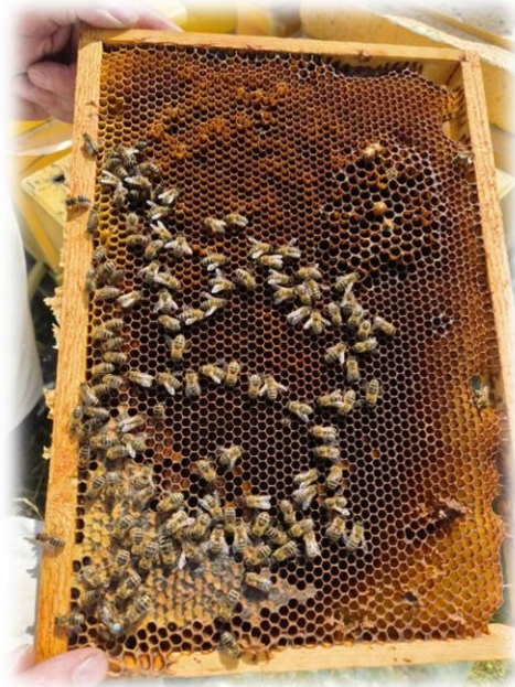
Bie & Honning i Lærdal