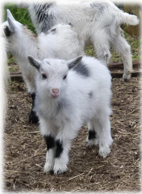
Killing i Årdal