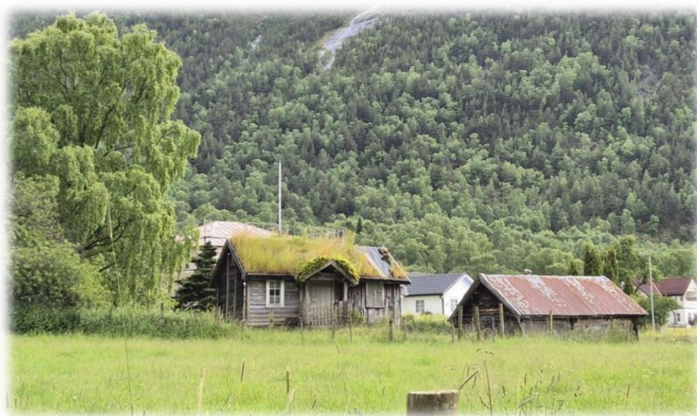
Kulturlandskap Naddvik i Årdal

Landbruksplan for ÅLA-kommunane skal vere ein plan som samordnar bruk av lokale verkemiddel, so langt det let seg gjere innanfor handlingsrommet kvar kommune har.