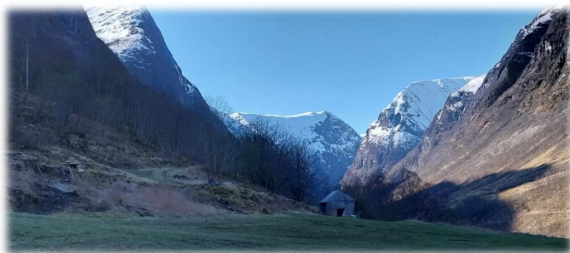
Vår på Hjødlo i Underdal